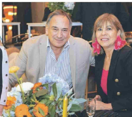
© Dr. Ariel Hasson, dermatólogo de Red Salud UC, y la Dra. Rosamary Soto, dermatóloga de DermaCDU.