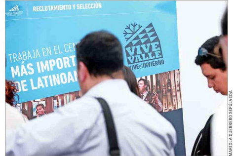
Los trabajadores entre 15 y 29 años son el segundo grupo etario con una mayor tasa de empleo precario.

aislada del panorama laboral general con una mayor informalidad (ver artículo inferior).