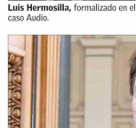
Ángela Vivanco, ministra de la Corte Suprema.