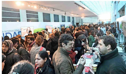
Los colaboradores entre fundaciones y universidades fueron parte de la "Conferencia Internacional de Ciudad 2024".