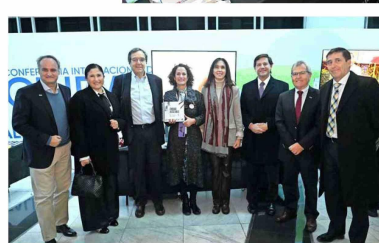
Autoridades de la CChC visitaron el stand de la Corporación Ciudad Accesible.