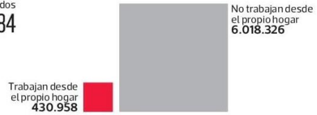
Porcentaje de asalariados que trabajan desde su propio hogar % del total de asalariados

Universo total Total asalariados 6.449.284