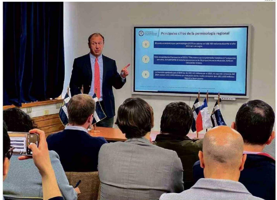
EN LA SEDE DE LA PATAGONIA DE LA USS, TUVO LUGAR LA EXPOSICIÓN DEL ÍNDICE DE COSTO ECONÓMICO POR PERMISOLOGÍA.