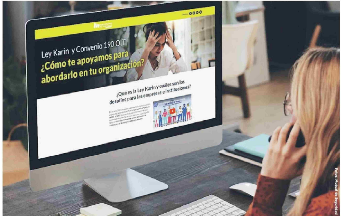
El sitio está disponible ingresando a www.mutual.cl

investigación de denuncias. Junto con capacitar a su personal y establecer mecanismos eficaces para la denuncia y resolución de casos de acoso y violencia laboral.