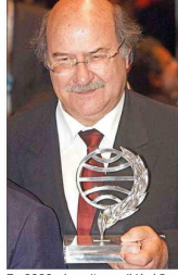
En 2003 el escritor recibió el Premio Planeta por la novela "El baile de la victoria".