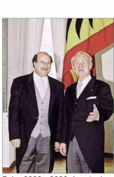
Entre 2000 y 2003, durante el gobierno de Ricardo Lagos, Skármeta fue embajador de Chile en Alemania.