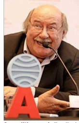
Con su última novela, "Los días del arcoritis", sobre el pléyisido de 1968, ganó el Premio Planeta - Casa de América.