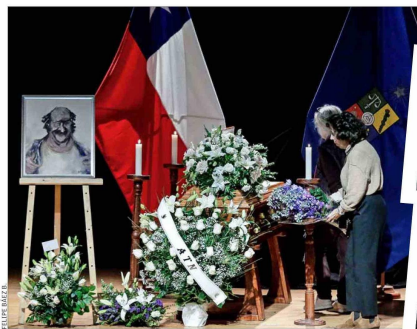
Durante la tarde de ayer, el escritor fue velado en el Teatro Nacional Chileno en una ceremonia organizada por la Universidad de Chile, que dio a conocer la noticia de su muerte.

"Gracias, maestro, por la vida vivida. Por los cuentos, las novelas y el teatro. Por el compromiso político. Por 'El show de los libros' que amplió las fronteras de la literatura. Por soñar que la nieve ardía en el Chile que te dejó tanto", declaró ayer en su cuenta de X el Presidente Gabriel Boric al conocerse la muerte del escritor, a los 83 años. Atestado por un cáncer al estómago en 2016, en los últimos años Skármeta llevaba una vida retirada; había publicado su último libro en 2015, "Libertad de movimiento". Pero no había dejado de estar presente, como lo demostró la gran cantidad de mensajes en redes sociales de la comunidad literaria y en el velorio que