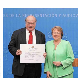
Skármeta obtuvo el Premio Nacional de Literatura en 2014 y se lo entregó la presidenta Bachelet.