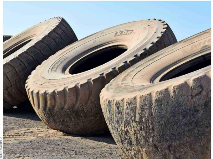
Acopio de neumáticos gigantes fuera de uso.

“En Exponor conversé con faenas y contratistas mineros que me comentaron que los sistemas de gestión no les están retirando sus neumáticos de manera eficiente. Las diferencias de precio entre