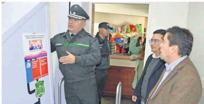
LAS AUTORIDADES EN EL ESCÁNER CORPORAL.