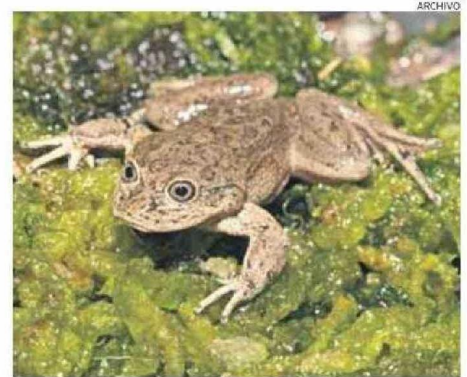
LA RANITA DEL LOA EN PELIGRO DE EXTINCIÓN AFECTADA POR INCENDIO.