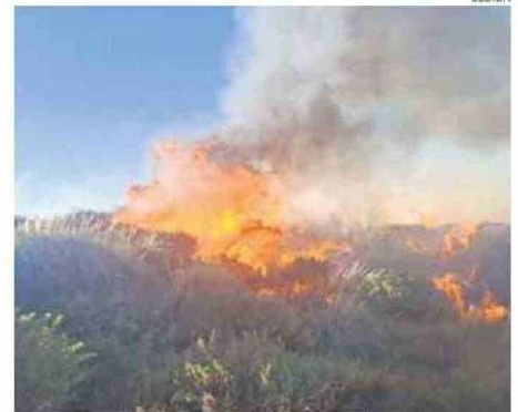
SINIESTRO CONSUMIÓ 4 HECTÁREAS INCLUYENDO HÁBITAT DE RANITAS.