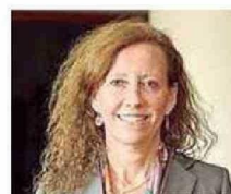
Ministra María Gajardo Harboe

● Ministro de la Corte Suprema desde el año 2019. Antes fue ministro de la Corte de Apelaciones de Santiago.