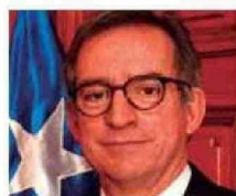
Ministro Arturo Prado Puga

● Asumió como ministro de la Corte Suprema el año 2005. Siendo propuesto por el ex Presidente Ricardo Lagos.