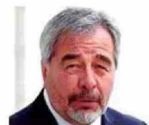
Ministro Gabriel Ascencio Mansilla

● Ministra de la Corte Suprema desde el año 2022. Fue directora de la Escuela de Postgrado de Derecho de U. de Chile.