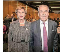
Maritza Larraechea y el expresidente Eduardo Frei Ruiz-Tagle.