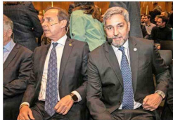
Los expresidentes Jorge Quiroga (Bolivia) y Mario Abdo (Paraguay).