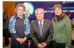
Lucía Santa Cruz, Enrique Paris y Paula Daza.