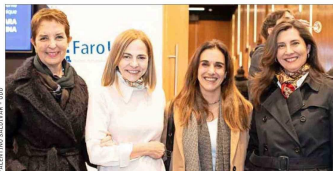
Gloria Hutt, Isabel Plá, Natalia González y Karin Moore.