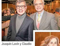
Joaquín Lavín y Claudio Hohmann.