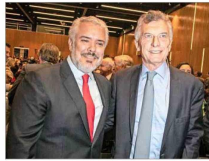
Los expresidentes Iván Duque (Colombia) y Mauricio Macri (Argentina).