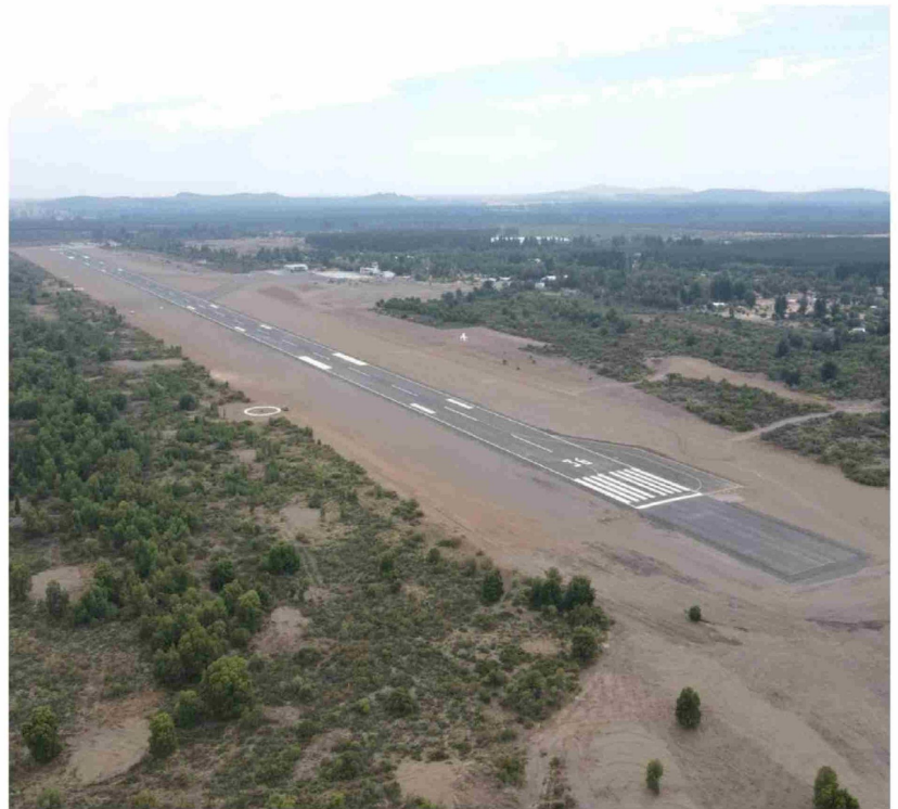
LA DIRECCIÓN DE AEROPUERTOS aseguró que el tamaño de pista de María Dolores no impide recibir aeronaves.

“Entre las conclusiones de ese estudio figuró que una eventual ruta comercial entre Santiago y Los Ángeles, al año 2026, podría captar 312 mil pasajeros al año. Esta cifra, sin embargo, significa solo el 8,6% de la demanda total de traslados ida y vuelta desde las zonas norte y central del