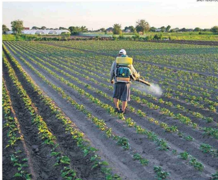
LAS DOSIS NO SON LETALES, PERO ESTOS PRODUCTOS AFECTAN NEGATIVAMENTE EL DESARROLLO DE INSECTOS.

Los insectos desempeñan un papel crucial en el mantenimiento del equilibrio de los ecosistemas y a medida que disminuyen sus poblaciones lo hace también la diversidad genética, fundamental para que las especies se adapten a los cambios