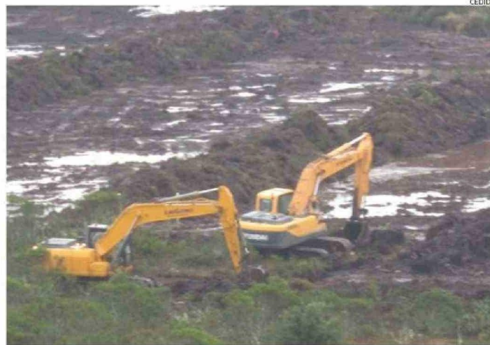
LAS OBRAS DE LAS INMOBILIARIAS QUE SE EJECUTABAN SOBRE EL HUMEDAL ESTÁN PARALIZADAS EN EL SECTOR DE VALLE VOLCANES.

De la Fuente comentó que actualmente su cartera “tiene abierta una licitación para levantar antecedentes que justifiquen la delimitación de humedales urbanos, en las regiones priorizadas, entre las que se encuentra la Región de Los