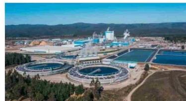
La planta MAPA que opera en Arauco es, hasta ahora, la mayor inversión que ha realizado la compañía.

Si bien este es el último anuncio que hizo la compañía, no ha sido el único, pues desde la empresa señalan que los proyectos que están desarrollando "se enmarcan en una mirada de largo plazo y responden al desarrollo, dinamismo