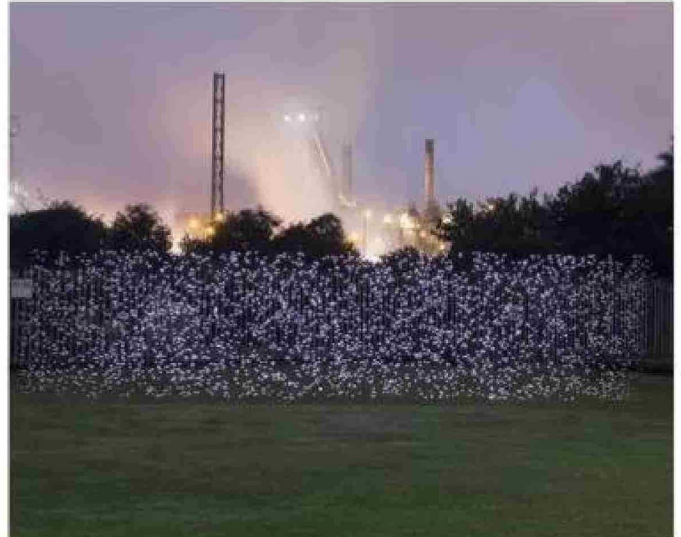
Un sitio de monitoreo de calidad del aire en el Reino Unido.