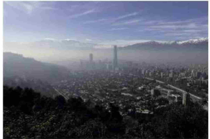
Se considera que América Latina tiene niveles desde moderados a altos en contaminación por el material particulado 2,5.

"a su vez, hace más difícil convencer a las partes interesadas de los países para que actúen, y responsabilizar a los responsables de las políticas, prácticas, normativas, leyes e inversiones que repercuten en la calidad del aire y la salud pública".