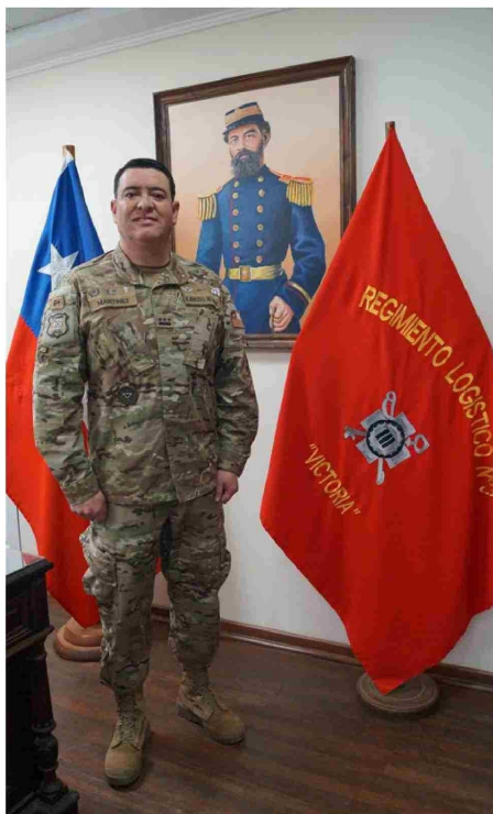
Comandante del Regimiento N°3 "Victoria", Coronel de Ejército Gonzalo Martínez Medel

Durante la actividad que se llevó a cabo para conmemorarlo, se entregaron condecoraciones por años de servicio al personal civil y militar que allí labora.