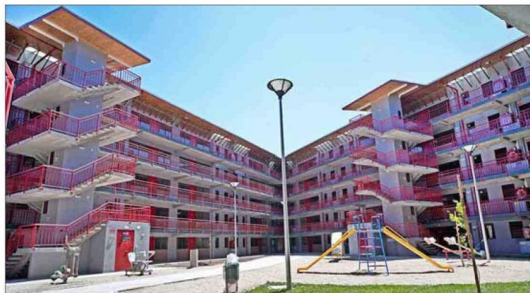
El barrio Maestranza Ukamau , en Estación Central, es una de las obras más importantes de este profesional formado en la Universidad Católica.