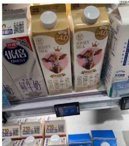
LECHES DE TODOS TIPOS SE VEN EN LAS GÓNDOLAS CHINAS.

que China retomará la senda del crecimiento económico, por lo tanto, el consumo de leche va a aumentar y así la leche nacional tiene una gran oportunidad de cubrir esa demanda.