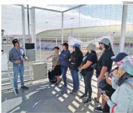
LA ESTACIÓN MUNICIPAL YA ESTÁ EN PROCESO DE CAPTACIÓN DE DATOS.

Cuatro estaciones de monitoreo a la calidad de aire están activas en Calama, equipos que captan datos.