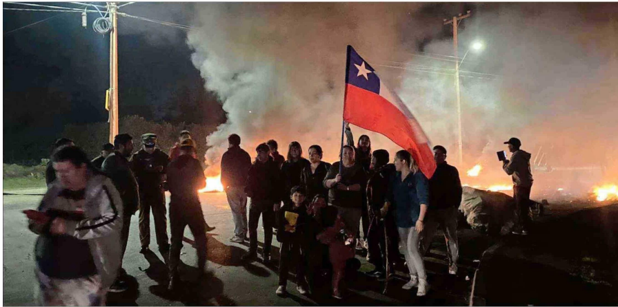
COLINA. — Por 13 días se han mantenido sin electricidad 300 familias de la zona norte de la Región Metropolitana. Mediante protestas pacíficas exigieron la reposición de un servicio cuya falta les ha causado, aseguran, pérdidas incalculables.

Sin embargo, fueron los usuarios de las comunas con mayor retraso en la reposición los que dieron cuenta de lo que ocurría.