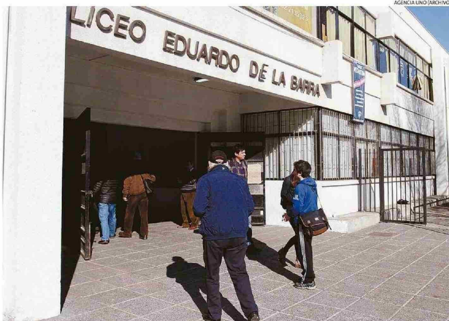
PRINCIPAL DESAFÍO DEL LICEO PORTEÑO, SEGÚN SU DIRECTORA, ES HACER PARTE A LAS FAMILIAS DE LAS TRAYECTORIAS EDUCATIVAS.

“Nuestros y nuestras estudiantes subieron mucho sus puntajes, así que estamos muy contentos, porque creemos que se empieza a consolidar un proceso postpandémico que nos costó mucho, con hartos rezagos a raíz de situaciones de salud mental, por lo tanto, no ha sido fácil retomar, sin embargo, hoy día estamos contentos con los resultados”, declaró la di-