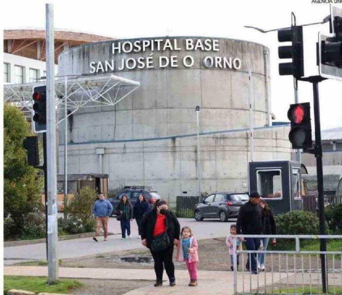
EL ACTUAL HOSPITAL BASE SAN JOSÉ DE OSORNO FUNCIONA EN CALLE GUILLERMO BÜHLER DESDE 1974.

-Este nuevo hospital tendrá todo lo que el actualmente el Hospital Base tiene, pero además debe irse desarrollando para mejorar cada día. Es decir, se construye, se equipa, se instalan todas las especialidades que tiene el actual, más las faltantes para que empiece a operar. No es un proceso corto, pero finalmente se concretará. Así pasó en Valdivia, Puerto Montt, es el proceso que tendrá Chillán, donde se está construyendo el nuevo hospi-