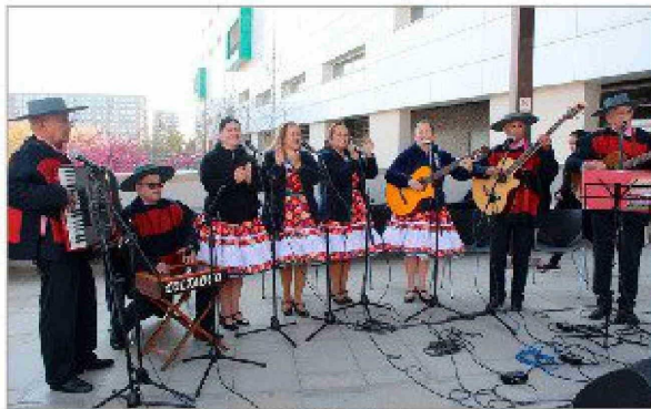
El evento estuvo amenizado por el Conjunto Folclórico Coltauco.