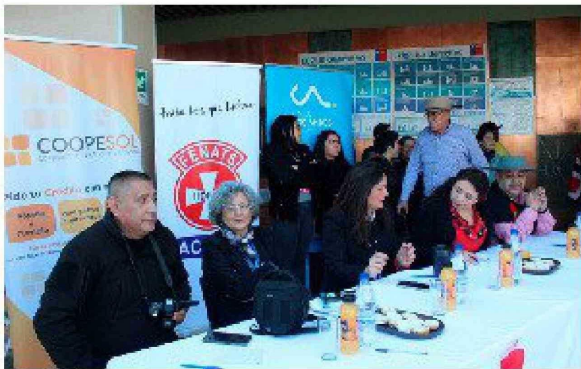
El evento contó con un jurado externo.