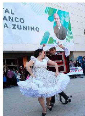
Realizan exitoso primer campeonato de cueca en el Hospital Doctor Franco Ravera Zunino.