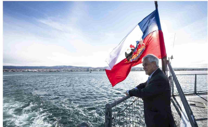
Durante el segundo mandato del Presidente Piñera se dictó el Estatuto Magallánico en Punta Arenas e importantes avances en descentralización.