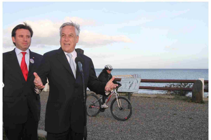
El Presidente Sebastián Piñera aparece aquí durante la inauguración de las obras en la Costanera de Punta Arenas, en octubre de 2013.

El parlamentario agregó que “Siempre es difícil ver partir a un ser querido, y más en estas circunstancias, por eso extendiendo mis condolencias y respeto a su familia y como católico, lo mantendré presente en mis oraciones”.