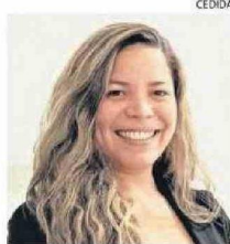
TARTAKOWSKY ES PSICÓLOGA.

El síndrome postvacacional es una realidad cada vez más común entre los laborantes, lo que trae consecuencias tanto personales como para las empresas u organizaciones por el nivel bajo de productividad.