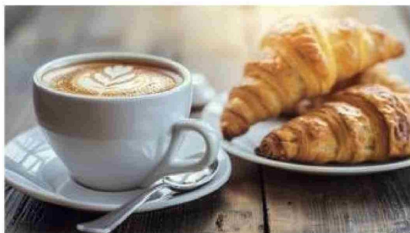
Cómo ajustar el consumo de cafeína para evitar interferencias en el descanso nocturno.