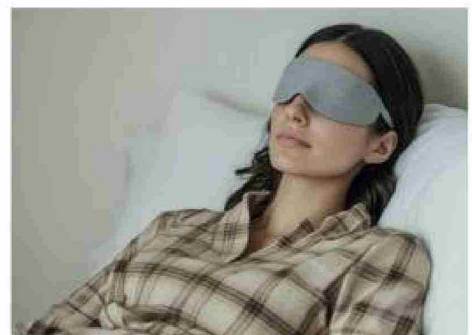
Siestas estratégicas, consejos para maximizar beneficios sin alterar el sueño nocturno.