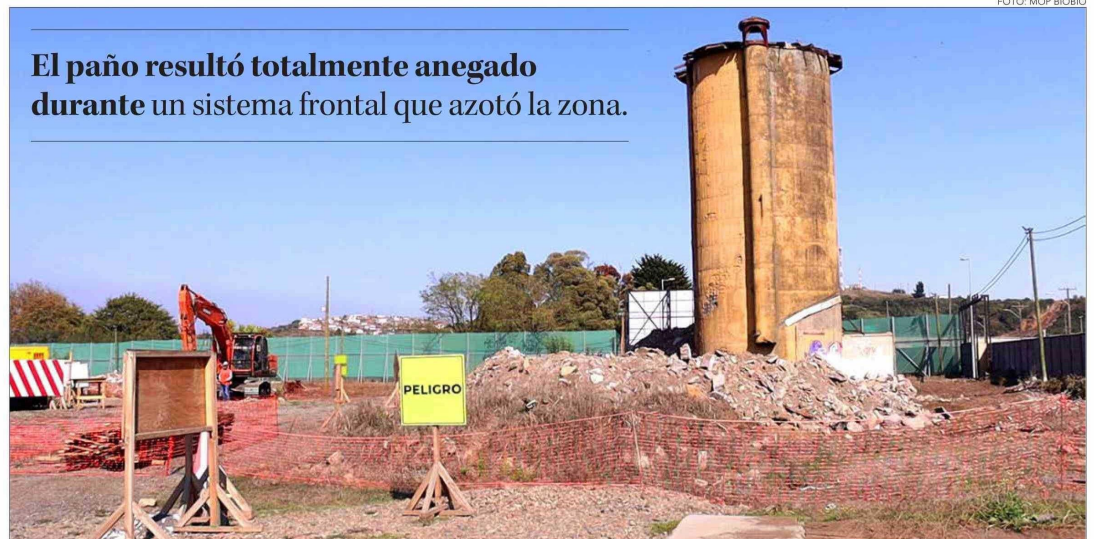
El paño resultó totalmente anegado durante un sistema frontal que azotó la zona.

Twitter @DiarioConcepcion contacto@diarioconcepcion.cl