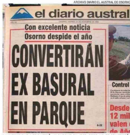
LA INTENDENCIA PROMETIÓ UN PARQUE EN 1993, PERO NO SE CONCRETÓ.

"Si hay una cesión de terrenos, como sería el ex basural, entonces ANFA procedería a la