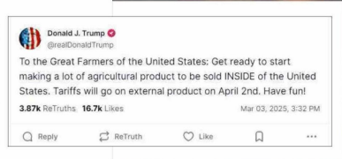
El Presidente estadounidense ha calificado en varias ocasiones los aranceles como “la palabra más hermosa en el diccionario”, y los ha utilizado como herramienta de negociación.

US$ 285 millones, y mandarinas y clementinas, por US$ 198 millones.