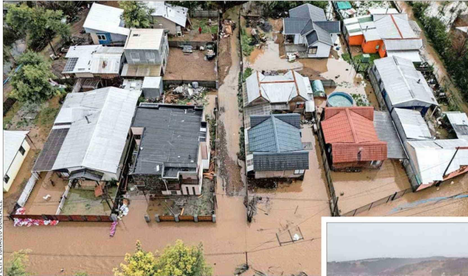
CONCEPCIÓN.— En los sistemas frontales que en varias etapas de cada invierno llegan a la capital de Biobío son recurrente los desbordes del río Andalién y la inundación de zonas pobladas.

SERGIO BAERISWYL PREMIO NACIONAL DE URBANISMO