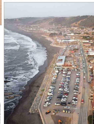
MAULE.— La reconstrucción de Iloca, localidad costera totalmente arrasada el 27-F por el sismo y las olas.

"lamentablemente, muchos de los desastres afectan a población vulnerable debido a su exposición, ubicada irregularmente en zonas de riesgo y sin las debidas mitigaciones". Undurraga plantea que "las actualizaciones en curso de las políticas nacionales de planificación urbana, rural y