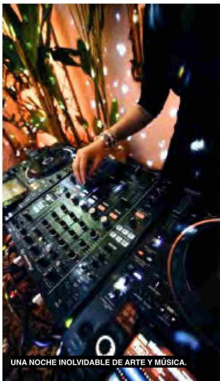
UNA NOCHE INOLVIDABLE DE ARTE Y MÚSICA.

Tiraje: 6.000 Lectoría: 18.000 Favorabilidad: No Definida