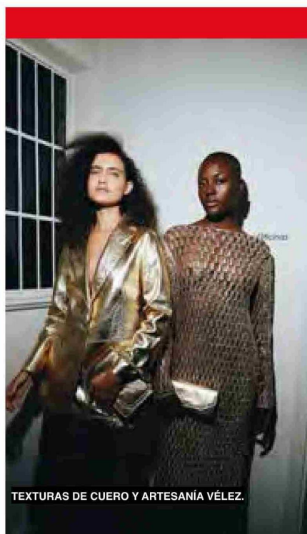
TEXTURAS DE CUERO Y ARTESANÍA VÉLEZ.

LA COLECCIÓN FW 24/25 DE VÉLEZ INTEGRA 30 LOOKS PARA HOMBRES Y MUJERES, CON UNA PALETA SOFISTICADA DE TONOS BURDEOS, NEGROS, MIEL, DORADOS Y BLANCOS CREMOSOS.