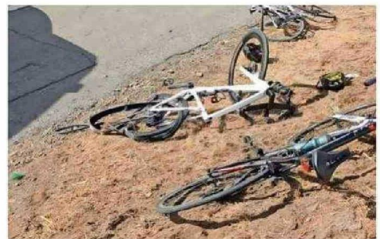
MOUAT TRANSITABA CON AMIGOS EN BICICLETA POR LA RUTA 5 A LA ALTURA DE PADRE LAS CASAS.

Mouat además destacaba por sus amplias capacidades en odontología y medicina estética, atendiendo a miles de usuarios