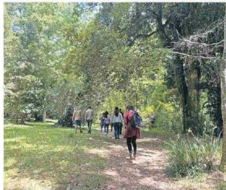
EL PARQUE TIENE 10,5 HECTÁREAS DEDICADAS A LA CONSERVACIÓN.

"Hoy me resulta significativo recordar el hecho que siempre existió como parte de la visión del plan maestro original, dejar parte del terreno, con una clara vocación de conservación y desarrollo de sus prestaciones ecosistémicas naturales. Durante los años en que el Comité Lemu Lahuén ha tenido la responsabilidad de administrar el Parque Urbano, se han desarrollado los actuales senderos y circuitos, sectores de observación y exposición, además de difusión permanente de los beneficios y servicios ecosistémicos que presta actualmente el Parque Urbano a la comunidad y a las personas que acuden regularmente.