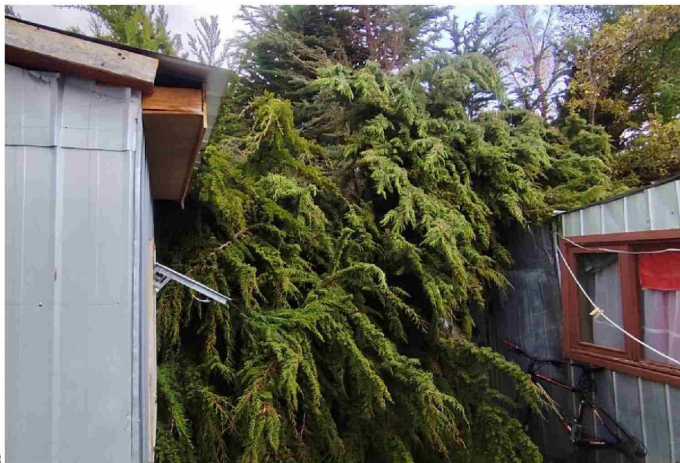
El gancho de un árbol cayó sobre dos viviendas interiores del Barrio Prat de Punta Arenas.

Un segundo llamado debió atender dos unidades de Bomberos, esta vez en calle Zenteno a la altura de José Robert, donde se reportó inicialmente una posible explosión de gas, pero esto quedó descartado, y se confirmó que el techo se habría desprendido por el fuerte viento, sin que se reporten lesionados.