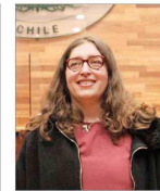
Fue nombrada por el Presidente Boric en 2022.

CONTINUARÁ EN 95 COMUNAS "QUE CORRESPONDEN PRINCIPALMENTE A CAPITALS REGIONALES" | c 9