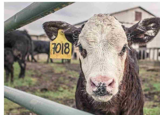
EL TRABAJO DE LOS GREMIOS puede ayudar a que las lecherías se mantengan competitivas y viables, promoviendo la sostenibilidad y defendiendo sus intereses.