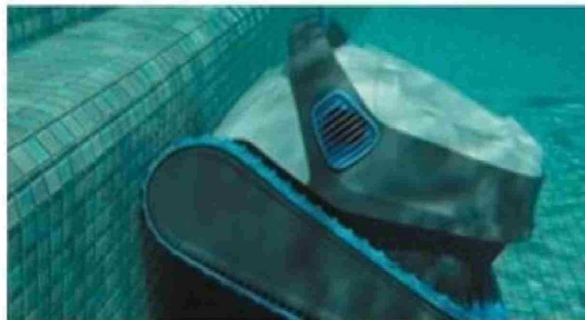
Un robot que limpia su piscina. Su valor en el mercado puede ir desde los $400 mil a $1.500.000.

pertos analizaron las implicancias de esta transformación y advierten sobre los desafíos que plantea.