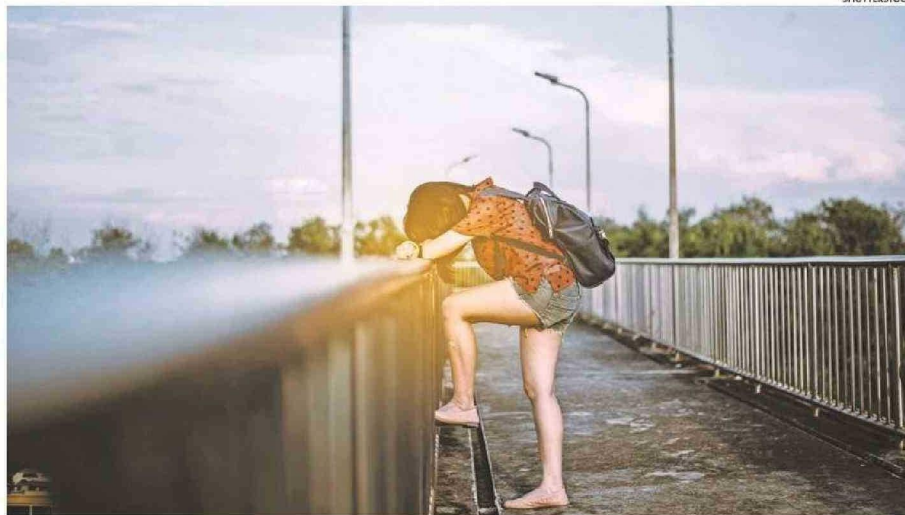
LA ORGANIZACIÓN MUNDIAL DE LA SALUD (OMS) ASEGURA QUE EL SUICIDIO ES UN PROBLEMA DE SALUD PÚBLICA A NIVEL GLOBAL.