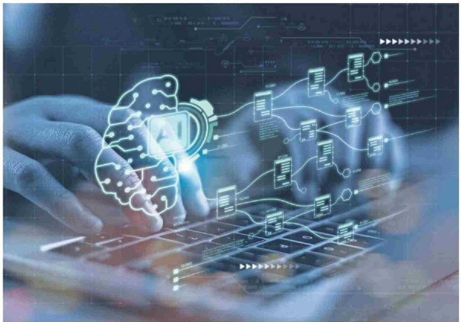
Los científicos decidieron emplear el aprendizaje por refuerzo, sentando una de las bases del desarrollo de la inteligencia artificial.

"Las herramientas que desarrollaron siguen siendo un pilar central del auge de la inteligencia artificial y han generado avances importantes, atraído legiones de jóvenes investigadores y impulsado miles de millones