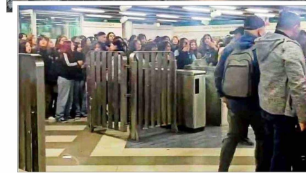
EVASIONES. — En la imagen del 12 de julio se ve a un grupo de estudiantes participando en las movilizaciones.

estaciones. Cuando identifica alguna situación de riesgo, analizamos caso a caso y aplicamos estos planes de seguridad según el tipo de incidente”.