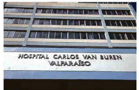
INDICACIÓN MÉDICA HABÍA SIDO CURSADA EL 20 DE DICIEMBRE.