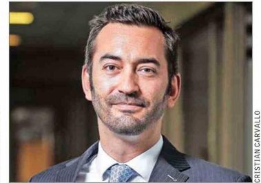
Nicolás Luksic Puga.

(matriz industrial del grupo del que se desuelgan empresas como CCU, Banco de Chile y sociedades como CSAV y Enx, entre otras), los sancionados igualmente estaban sujetos a la prohibición de realizar tales transacciones durante el período de bloqueo establecido por la normativa citada. Este lapso tiene por objeto evitar que ciertos agentes, debido a su posición al interior de firmas o sociedades emisoras de valores, operen en el mercado con ventaja de información.