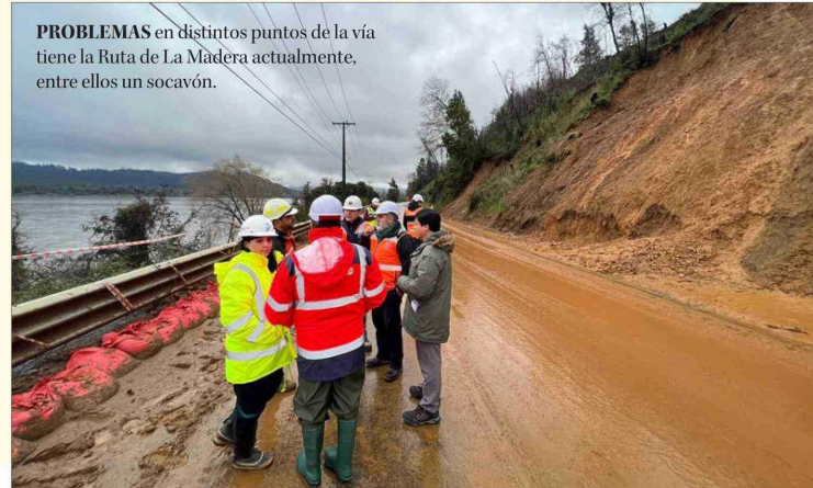
PROBLEMAS en distintos puntos de la vía tiene la Ruta de La Madera actualmente, entre ellos un socavón.