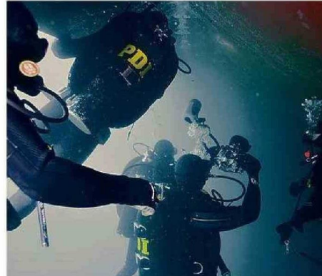
SE ORIGINA EN EL AÑO 2010. REGISTRAN 350 PROCEDIMIENTOS.

La Deosub mantiene jurisdicción a lo largo del territorio nacional. Gracias a su enfoque especializado, explica su jefe de Brigada,