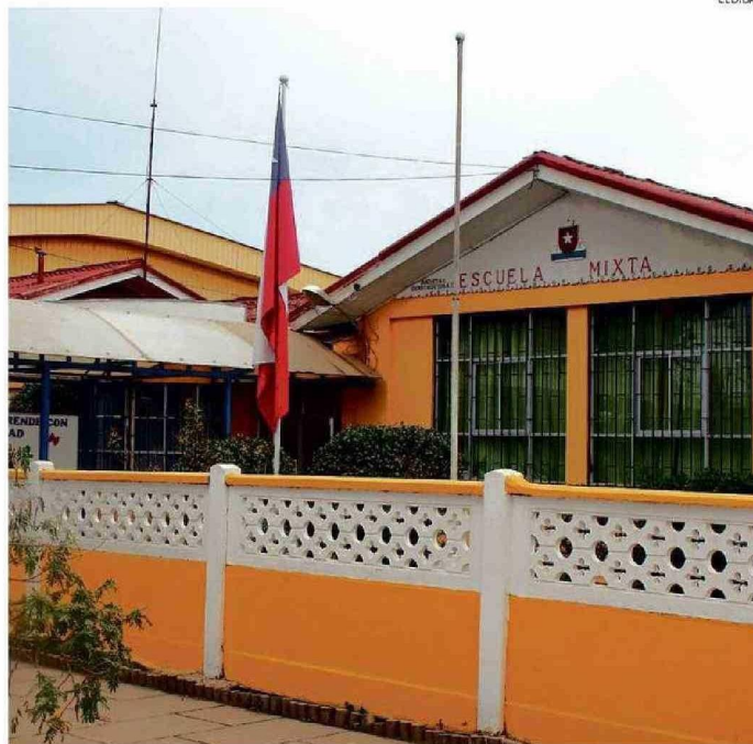
LA ESCUELA BÁSICA LAS CRUCES TENDRÁ LAS MESAS DE LA 26 A LA 43.

“Ante esto, ya se ha determinado (...) adelantar el término de clases este miércoles para los alumnos de Las Cruces a las 13.30 horas y lo mismo ocurrirá en el Colegio El Tabo, pero media hora antes, es decir a las 13.00 horas”, afirmó.