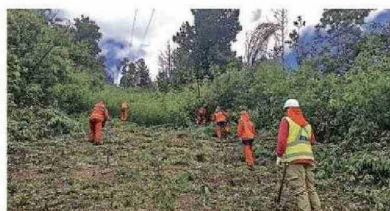
Junto a la comunidad y con todos los recursos en terreno la compañía avanza para asegurar el mantenimiento de su red eléctrica