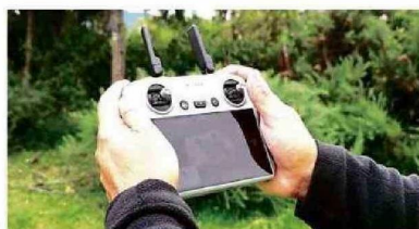
Saesa continúa integrando soluciones tecnológicas para monitorear y prevenir posibles riesgos que puedan afectar el servicio eléctrico.

durante este año y en temporadas anteriores, logrando la recuperación de gran parte del servicio de manera coordinada, después del gran evento climático que afectó a la compañía y sus clientes en agosto pasado. Este verano, Saesa continúa optimizando su respuesta mediante una red más resistente e inteligente para enfrentar los desafíos estacionales.