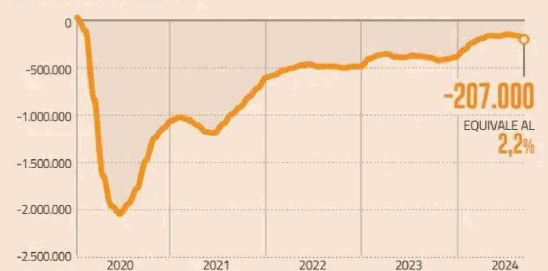
RESPECTO DE SITUACIÓN PRE-PANDEMIA DEFICIT DE NÚMERO DE EMPLEOS