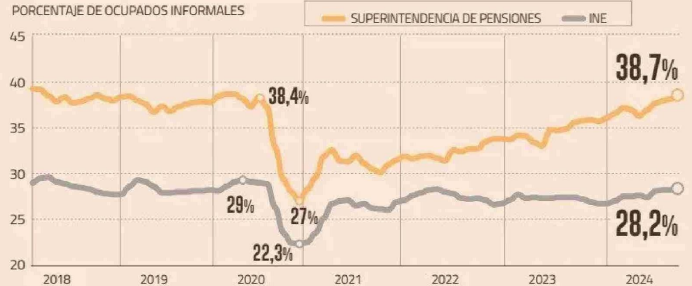
TASAS DE INFORMALIDAD LABORAL PORCENTAJE DE OCUPADOS INFORMALES